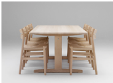
Open the door to Europe